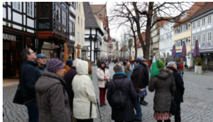
Stadtführung in Hameln / Tra-urba gvidado en Hameleno

Ĉirkaŭ 50 homoj partoprenis en tiu ĉi rendevuo kombine kun la 30-jariĝo de Esperanto-Grupo Hameleno. La programo estis riĉa kaj alloga, kaj ĉio estis perfekte organizita de esperantistoj surloke, same kiel tio trafis okaze de la Germana Esperanto-Kongreso (GEK) du kaj duonan jarojn antaŭe en la ratkaptista urbo. Tial iu ŝerce nomis la aranĝon "GEK 2015 du punkto nul". Aldone al tra-urba gvidado kaj ludo, ĉe kiu temis pri tio, eskapi el alĥemista