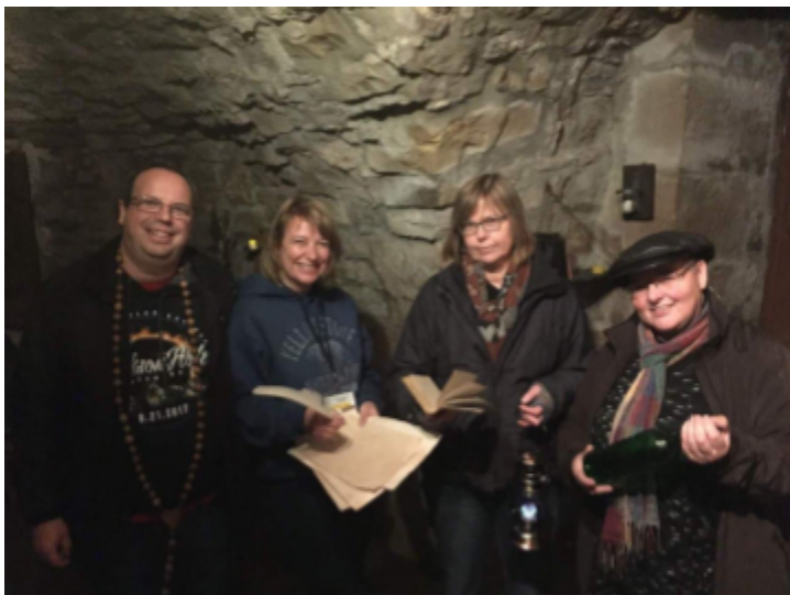
Nach dem erfolgreichen Entkommen aus dem Alchemisten-Zimmer / Post sukcesa eskapo el la alĥemista ĉambro

(Heinz-Wilhelm Sprick), "Safario tra Usono" (Bernard-Régis Larue) kaj "Unua helpo" (Frank Lappe). La prelegoj estis faritaj en aranĝocentro "Sumpflume". Tie en la sabata vespero estis tamen muziko kaj dancado en la fokuso: folklormuziko de la nederlanda grupo "Kajto kvarope" kaj krome regeo kaj hiphopo de Jonny M el la proksimo de Kolonjo. Kadre de la rendezuo okazis ankaŭ la jarĉefkunveno de Esperanto-Ligo de Malsupra Saksujo. Ĉe tio ĉefa tagordero estis elektoj al la estraro: La prezidanto, vic-prezidanto kaj trezoristino estis konfirmitaj en siaj oficaj postenoj; du asesoroj estis nove alelektitaj. (Asesoroj ne estas nepraj laŭstatute, kaj antaŭe vakis la postenoj.) – Andreas