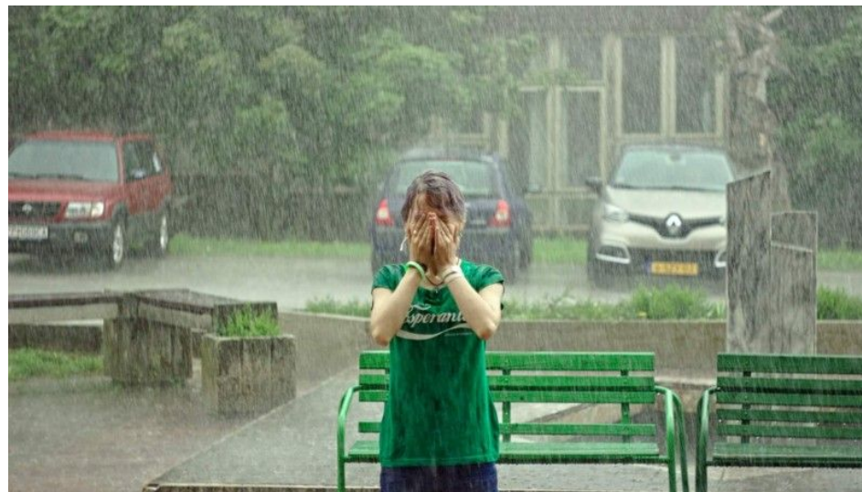
Pluvis nur fine de SES / Es regnete erst am Ende des SES

– Krištof Klestil (li origine publikigis sian artikolon ĉe Medium [ https://goo.gl/v8dEhJ ], kaj kun lia permeso ĝi estas redonita ĉi tie)