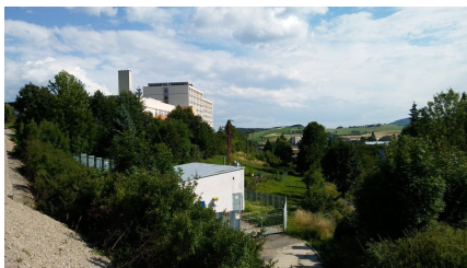
Maldekstre: SES-ejo / Links: SES-Gebäude