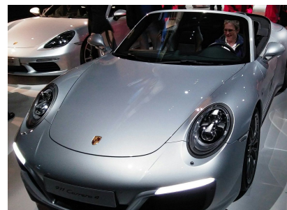
Sidi en Porsche / In einem Porsche sitzen

teknikaĵoj kaj elektronikaĵoj. Fine ni partoprenis la unuhordaŭran marecan panoramo-ŝipekskurson sur Mezlanda Kanalo. La ekskurso kondukis nin preter interalie la Volkswagen-fabriko kaj Volkswagen-areno. Interese estas vidi la sekurecan stir-trejnadon kun eksterordinaraj obstakloj. La aŭtourbo valoras vizitadon. Tre agrable estis veturi per trajno, ĉar la stacidomo situas proksime, kaj per ponto estas atingebla la